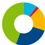
Leeftijd cursisten 2021

<30 18% 30-40 26% 40-50 44% 50-65 10% 65+ 2%