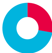
Man/vrouw STEP 2021